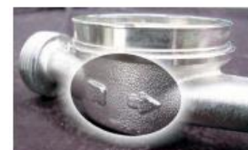
Abb. 8: Der Richtungspfeil auf oder in dem Gehäuse des Wasserzählers ist wichtig. Falsch herum eingesetzte Wasserzähler entsprechen nicht dem Eichgesetz.

Bei Erneuerung bzw. Wiedereinbau der Wasseruhr ist unbedingt auf die richtige Fließrichtung (Pfeil auf Wasseruhr) zu achten.